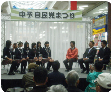
農業アイドル「愛の葉ガールズ」とトークショーを行う。(11/30、松山市大街道)