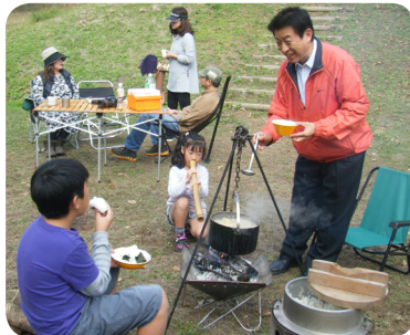
10月に皆で稲刈りをした新米を頂く。(11/9、松山)