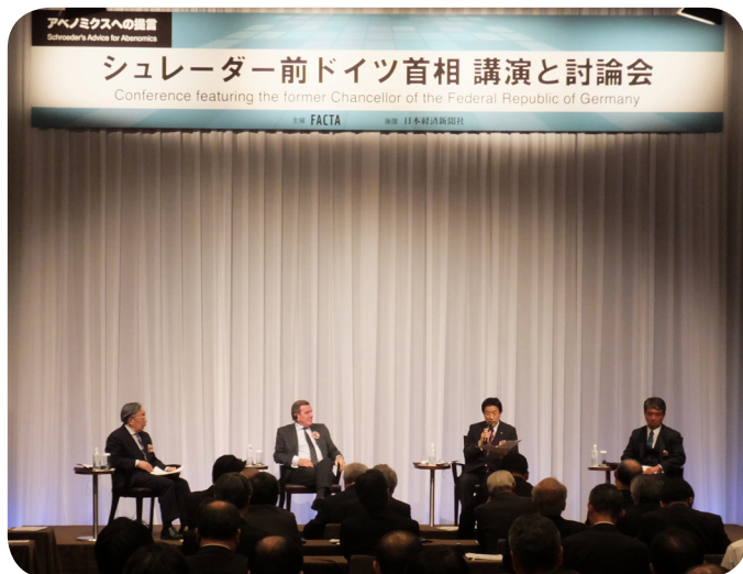
ドイツのシュレーダー前首相（左から2人目）、八代尚宏・ICU客員教授（左端）、木下信行・日銀理事（右端）らとパネルディスカッション。シュレーダー氏からは、日本の成長を阻害している様々な要因を、政治の強力なリーダーシップで改革せよ、との強いメッセージ。（12/4、東京）

昨年秋季より、衆・予算委員会筆頭理事を務めています。皆様と心を一にして、自民党を変え、松山・愛媛を守り、日本を救うという大きな使命感を持って、全力で頑張りたいと思います。皆様の益々のご指導を宜しくお願い申し上げます。