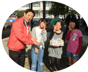
地域文化祭にて「赤米」を売る地域児童と。(11/4、松山)