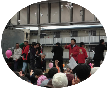
地域農業祭にて、思い切り餅まき。(12/1、松山)